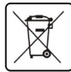
Don't leave it in the trash