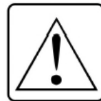
Pay attention to the attached documents