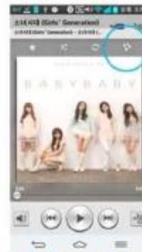
LG Smartphone (new version)