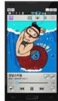
LG Smartphone (old version)

Smart phones van Nokia, Motorola HTC, Sony, etc hebben verschillende UI voor DLNA