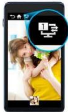
Galaxy Series (old version)