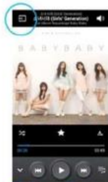
Galaxy Series (new version)