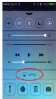
Apple product (iOS7.0)